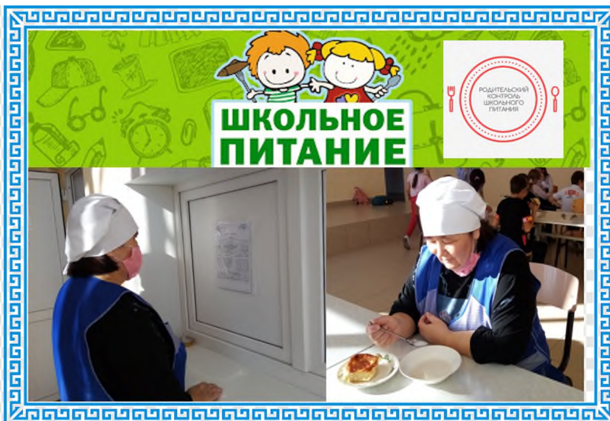
График питания школьников сформирован с учетом наполняемости классов и безопасной рассадки детей в столовой в условиях предупреждения распространения новой коронавирусной инфекции. Замечаний по итогам проверки организации горячего питания у родителей не было.

Комиссия проконтролировала соблюдение санитарных правил работниками пищеблока, соответствие приготовленных блюд и меню, было произведено взвешивание контрольного блюда, сняты пробы. Рацион питания соответствует нормам СанПиН.